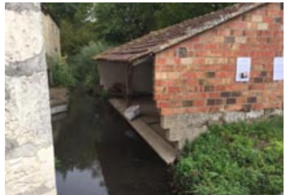
Le lavoir ru de l'Abreuvoir à Linant