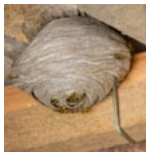
Nid de guêpes

cette maladie. Cette dernière ne touchant plus seulement les personnes les plus vulnérables, il reste recommandé de garder, encore quelques temps, vos précautions.