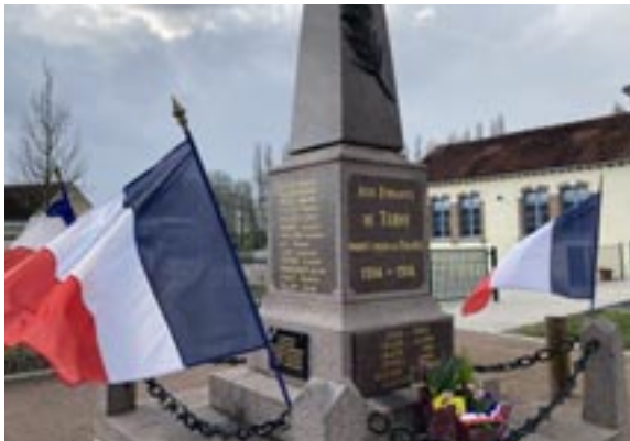
8 mai 2021 au monument aux morts de Turny