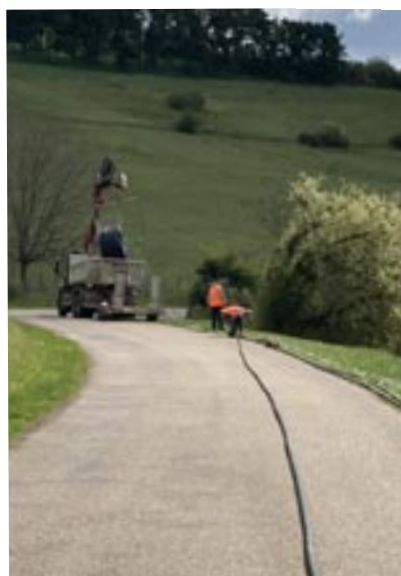
Passage de la fibre entre Le Fays et Le Saudurant

Les travaux avancent... Vous avez vu les tranchées le long des routes, là où n'y avait pas déjà des fourreaux qui puissent permettre le passage de la fibre. Des chambres dans lesquels des raccordements sont réalisables ont été ajoutées. Puis, c'était le tour des ouvriers qui tiraient le câble, d'une chambre à l'autre et dans les agglomérations, faisaient monter cette fibre sur les poteaux électriques ou téléphoniques. Sur ces poteaux, des boîtiers sont installés. C'est de ces boîtiers que la fibre partIRA pour alimenter les maisons.