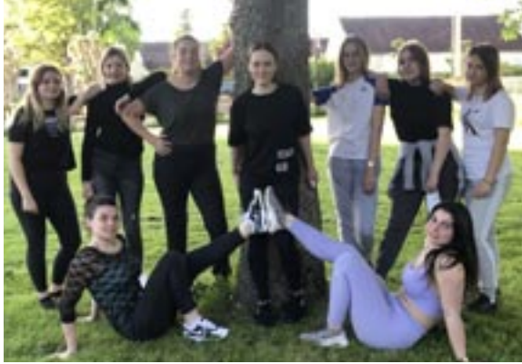
Gruppe de Justine

En continuité de l'année 2020, c'est avec tristesse que cette année encore la troupe ne pourra pas vous présenter son gala annuel au vu de la situation sanitaire.