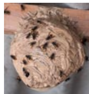
Nid de frelons

L'été approche et comme à mon habitude, je tiens à réaliser de la prévention sur les risques saisonniers. L'été dernier fût marqué par une importante quantité de nid de guêpes et de frelons, que nous sommes encore, sur notre commune, habilités à détruire gratuitement. Dans le cas où vous auriez un nid chez vous, n'hésitez pas à appeler la mairie afin que nous mettions en place les mesures nécessaires à sa destruction, si cela reste matériellement possible pour nous. Afin de vous aider à mieux reconnaître ces nids, ainsi que leurs habitants, je vous laisse en illustration de quoi les identifier.