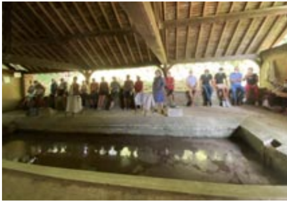
Le lavoir des Gueules de loups à Linant

En janvier, nous espérons des jours meilleurs... Ils semblent arriver ! Nous devons donc reprendre les activités nécessaires à la poursuite de notre but : "participer à la sauvegarde du patrimoine communal."