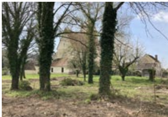
Aménagement du terrain derrière l'église

La rue du Magoula verra son revêtement repris dans le cadre des travaux menés par la communauté de communes. Les habitants sont prévenus de ces travaux afin de ne pas y stationner leurs voitures.