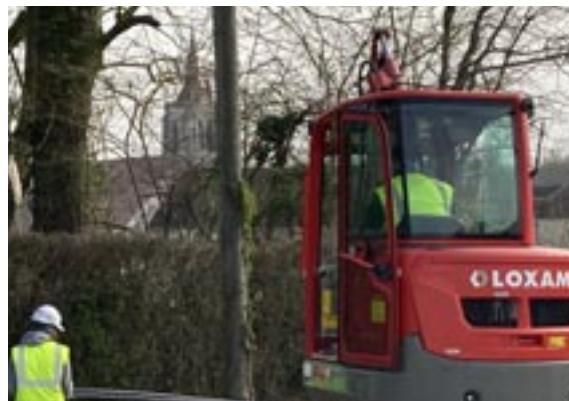
Passage de la fibre à Turny

Il faudra donc prochainement amener un câble de ces boîtiers vers votre domicile. Ce sera le travail de l'opérateur que vous aurez choisi, puisque les 4 opérateurs Orange, SFR, Free et Bouygues auront la possibilité de vous démarcher, 3 mois après la fin des travaux dans la commune. Chez vous, le câble doit pouvoir emprunter le même chemin que votre câble téléphonique actuel. Il ne peut être agrafé, il sera collé. A son extrémité ce ne sera pas une prise, mais un boîtier. Son emplacement sera définitif ! C'est sur ce boîtier que la box Internet sera branchée. La box transformera le signal optique en Wifi et en signal Internet alimentant les prises RJ45 classiques. C'est de cette box aussi que partira le téléphone. Ce qui veut dire que les personnes n'ayant actuellement pas de box, mais seulement le téléphone, devront avoir une box où l'internet sera désactivé car les réseaux téléphoniques cuivre vont disparaître... pas tout de suite, mais à moyenne échéance.