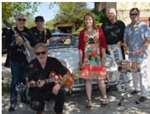
Le groupe pop-rock Vice Versa