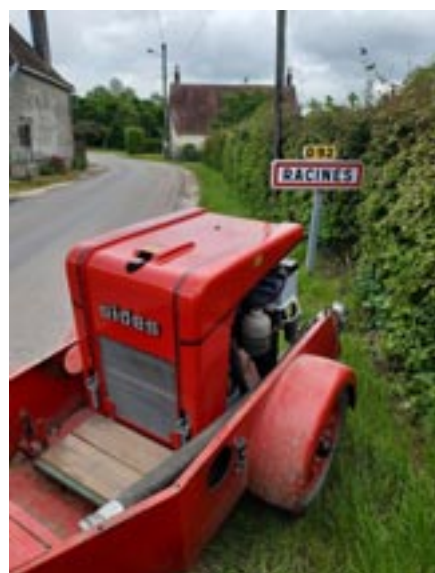
Motopompe du CPI

Pour rester dans la nouveauté, l'Amicale des sapeurs-pompiers de Turny a racheté au mois de mars, une motopompe, permettant un meilleur débit d'eau sur les incendies. Cet achat fait suite à la fermeture du Centre de Première Intervention (CPI) de Racines (10), qui, suite à un manque d'effectif et de recrutement, a été contraint d'arrêter ses activités. Cette motopompe présente, sous forme de remorque, une ressource nécessaire et efficace sur incendie. Ressource d'autant plus importante que notre commune présente de