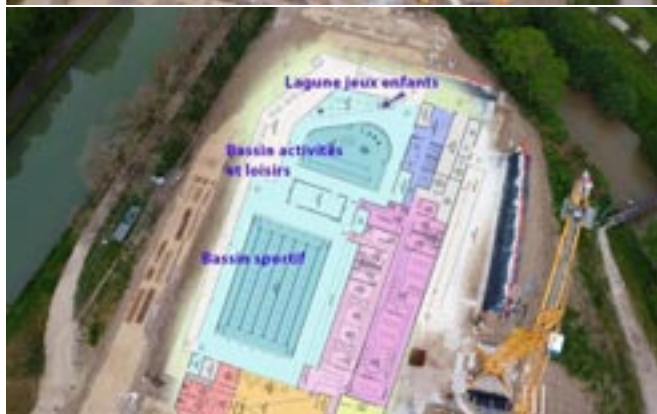
Travaux du Centre nautique à Saint Florentin par la CCSA

SARL RG Electr'eau Plomberie Electricité