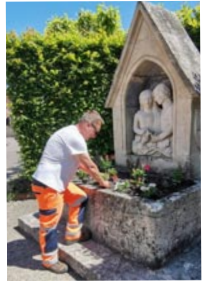
Fleurissement par la commune

Cette année, des jardinières et suspensions embellissent les lavoirs de la Croix Saint Pierre à Turny, de la rue de l'Abreuvoir à Linant, du lavoir du Fays ainsi que des puits de Linant et du Saudurant. Quand à la fontaine, des plantes aromatiques sont venues rejoindre les annuelles. Les plantes aromatiques seront à votre disposition avec parcimonie bien évidemment dès cet été.