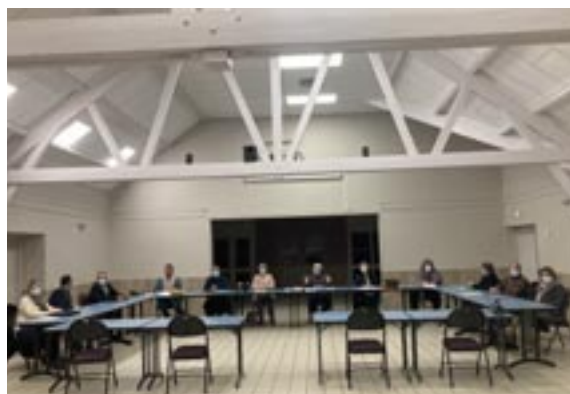
Les réunions du conseil municipal se sont déroulées dans la salle des fêtes afin de respecter les gestes barrières