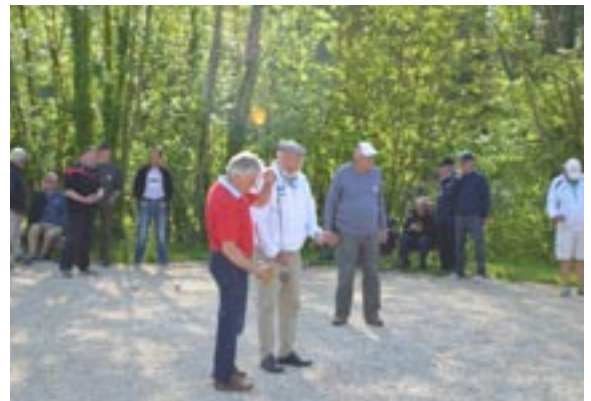
Turny Pétanque sur les terrains Chemin de Ronde